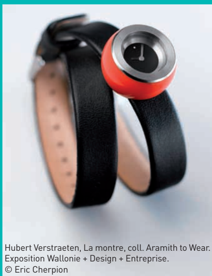
Hubert Verstraeten, La montre, coll. Aramith to Wear. Exposition Wallonie + Design + Entreprise.