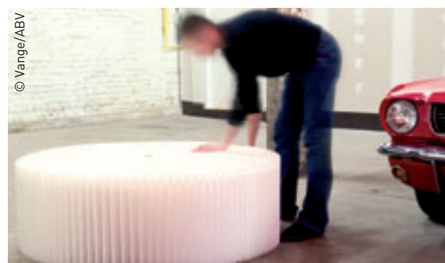
K-bench par Charles Kaisin