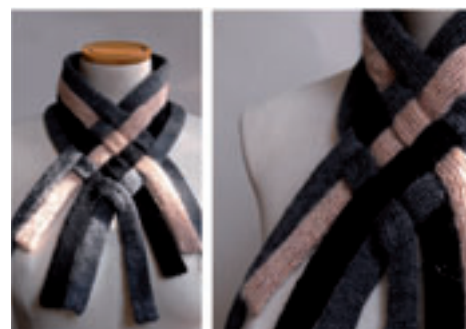
Echarpe, ma parure.